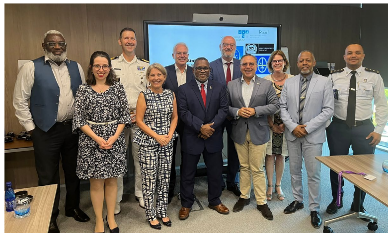
Samenwerking met de Raad van State.